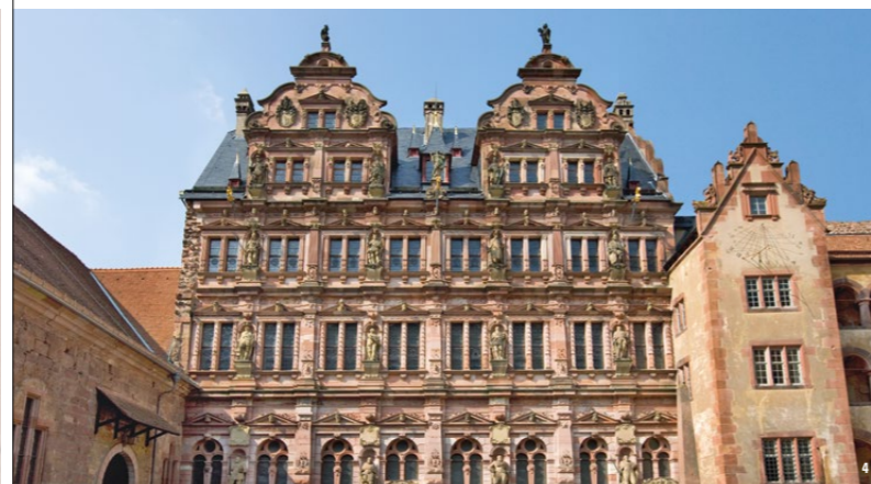
Los antepasados de los príncipes electores palatinos saludan orgullosos desde el edificio Friedrich

Hasta la Guerra de los Treinta Años, el Castillo de Heidelberg albergó una de las cortes más importantes del reino. La actividad constructora iniciada por los príncipes electores dio como resultado un conjunto de edificios fortificados y representativos: ala de cristal, edificio Ottheinrich, edificio Friedrich y edificio inglés. Todos son magníficas creaciones arquitectónicas del Renacimiento. Sus espléndidas fachadas forman un marco ceremonioso y majestuoso hacia el patio interior.