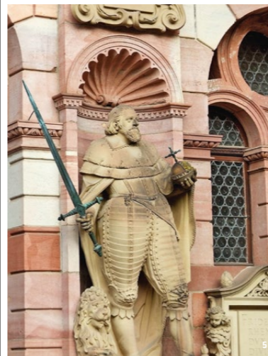
Muchas figuras decoran los edificios palaciegos. Esta estatua representa al príncipe elector palatino Friedrich IV.