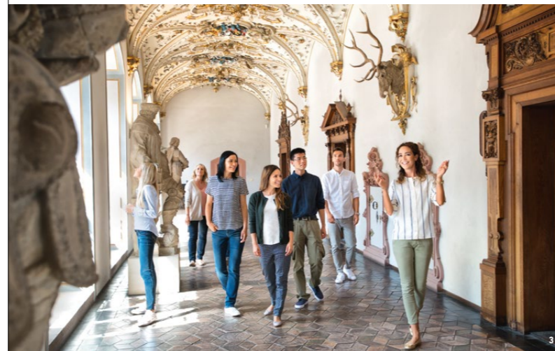
Con lujosos añadidos en el siglo XIX: el edificio Friedrich con techos estucados así como puertas de madera y arenisca

Una joya del Renacimiento alemán: el edificio Ottheinrich